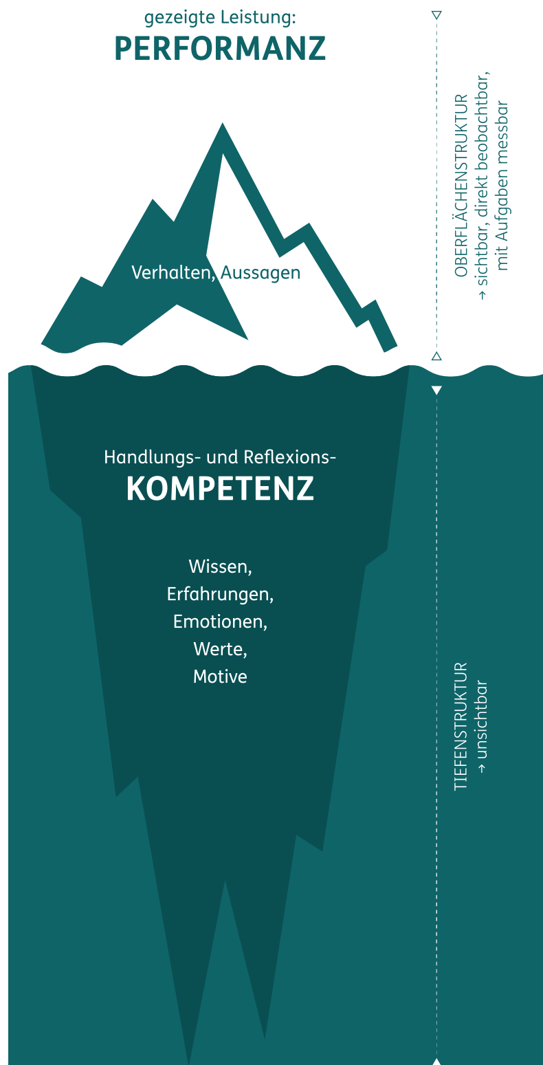
Abbildung: Oberflächen- und Tiefenstruktur

Allerdings ist das, was sich an der Performanz, im Verhalten einer Person zeigt, nie deren ganze Kompetenz, sondern immer nur ein Ausschnitt. Um kompetent zu handeln, sind Wissen, bestimmte Fertigkeiten, eine bestimmte Haltung, Erfahrung und Motivation nötig. Wissen allein ist also keine Kompetenz – ebenso wenig wie die anderen Elemente. Erst die Verbindung dieser Komponenten führt zur Kompetenz.